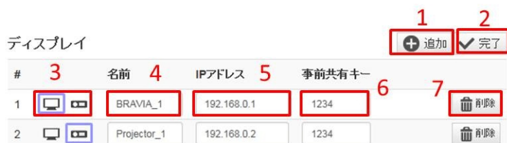
図3 ディスプレイ編集

ディスプレイ編集モード (図3) ではサーバーに接続するディスプレイ情報の追加・更新・削除を行うことができます。まずディスプレイ追加ボタン (1) を押すとエントリが追加されるので、BRAVIAかプロジェクターの選択 (3)、ディスプレイの名前 (4)、IPアドレス (5)を入力してください。